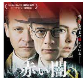
登場人物(左から) ウォルター・デュランティ / ガレス・ジョーンズ / エイダ・ブルックス

・ジョージ・オーウェル: (映画の時点では) 新進作家。後に、スターリン体制を痛烈に批判した風刺小説『動物農場』(1945)、全体主義的ディストピアを描いた『1984年』(49)などで有名になる。『動物農場』の農場主の名前が“ジョーンズ”なのも興味深い。