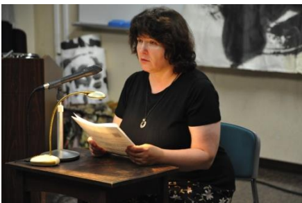
◆ シヤレック・レナタ 「ムロジェックの名句」