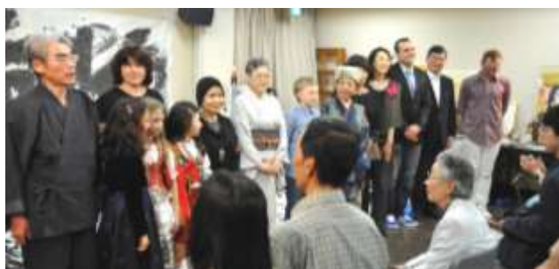
出演者のカーテンコール