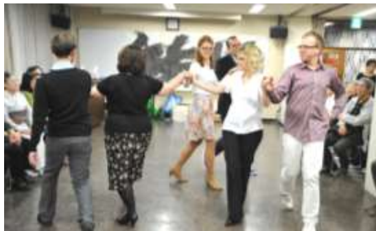
♪ 在北海道ポーランド人舞踊団「ポロネーズを踊ろう」