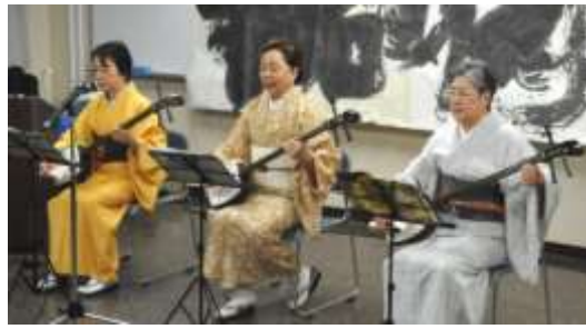
♪ 端唄・三味線花季会社中 (三味線演奏) 「黒田節」、「祇園小唄」他