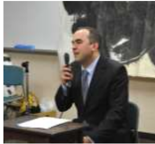
◆ マズル・ミハウ 「ポーランド語の発音を詩で練習しましょう」