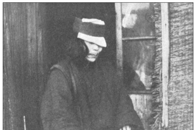
(2) 1934 年 1 月のチュフサンマ [Janta-Polczyński 1936]