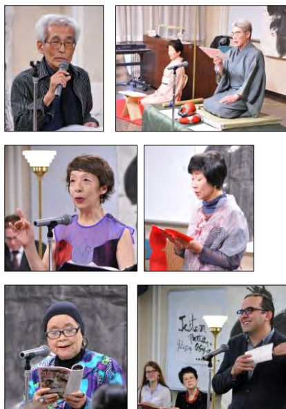
写真は昨年までの様子