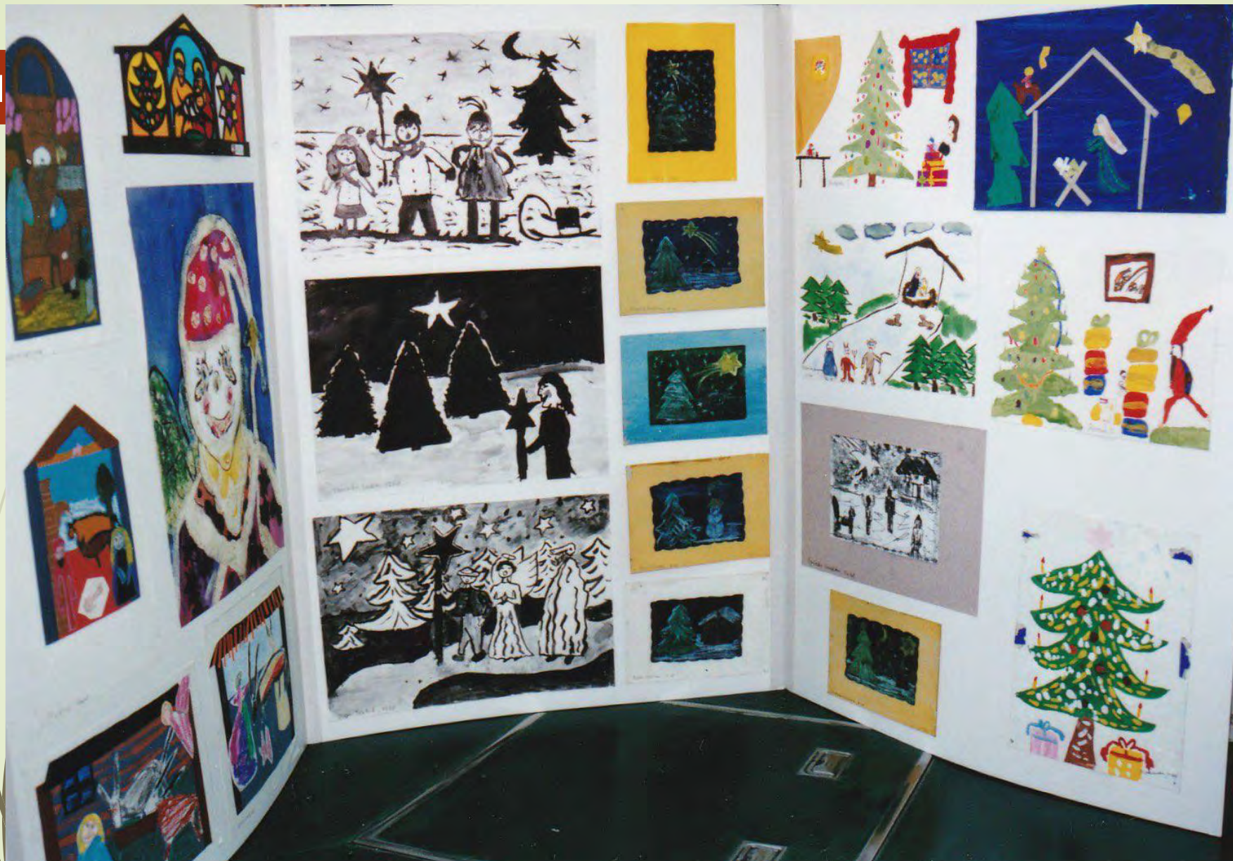
ポーランドの子供の絵の展示会 1991年？