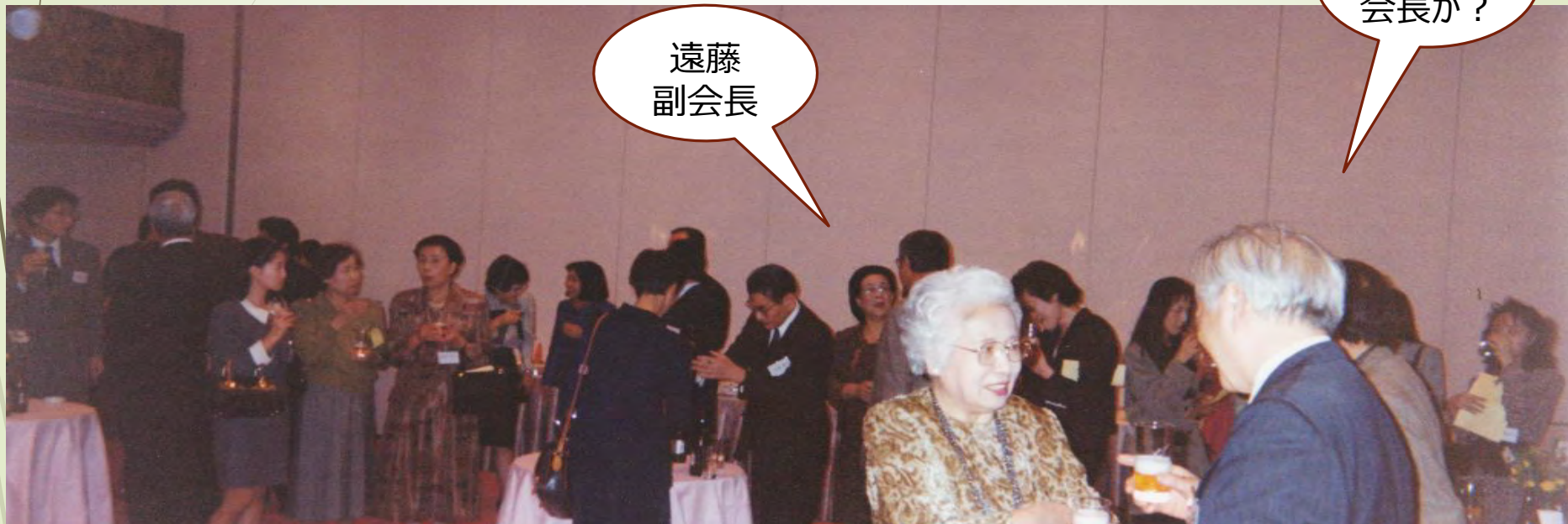
1990年頃 すみれホテルでの総会・懇親会