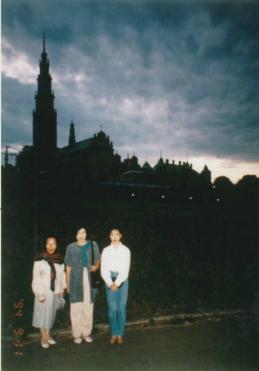
チェンストホヴァ の夕暮れ