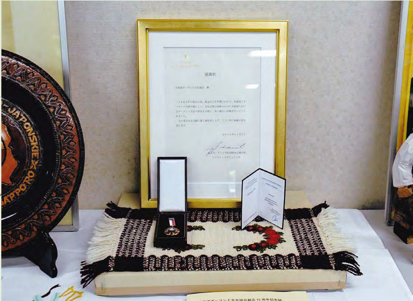
2013年にポーランドからいただいた文化功労章