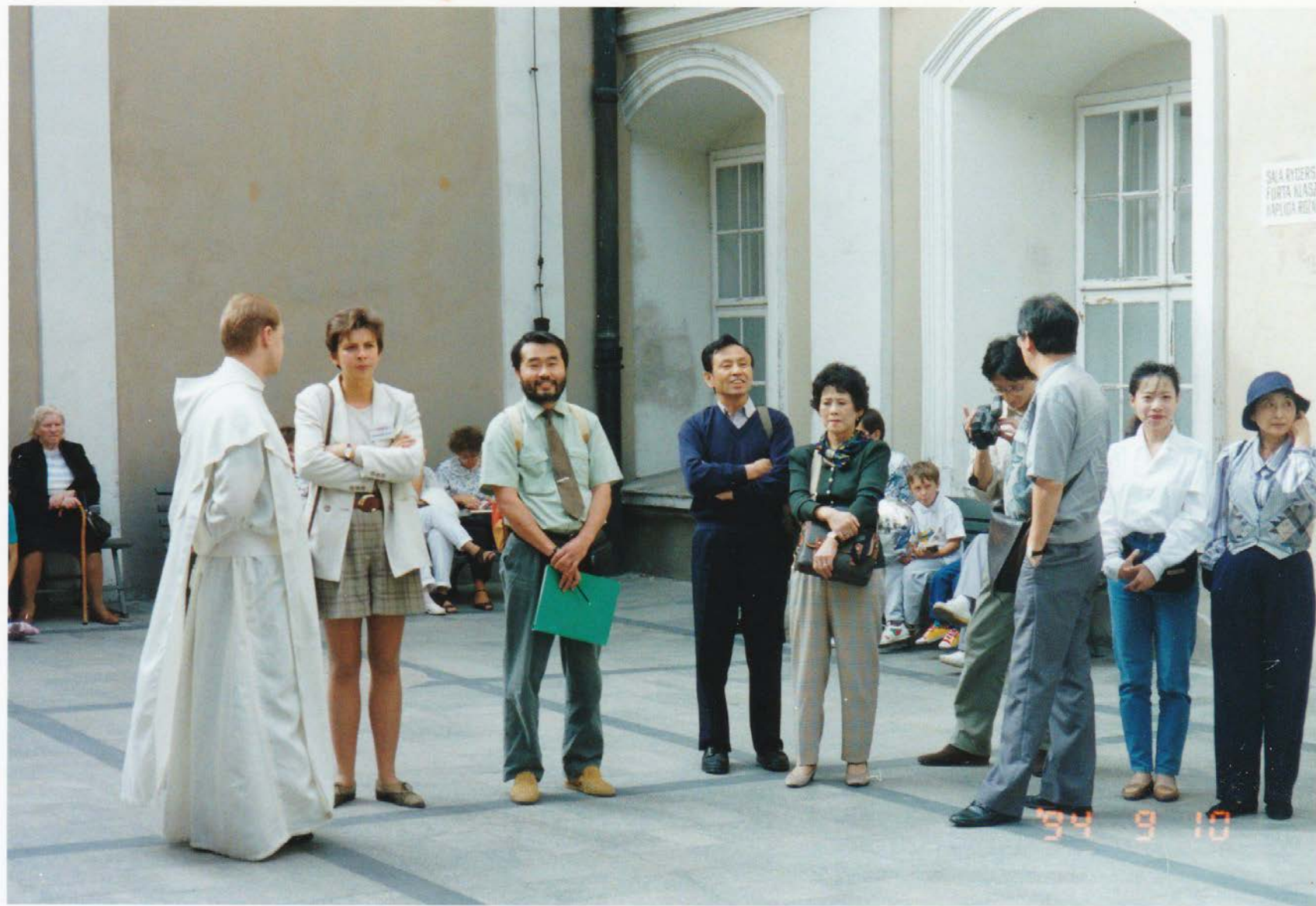
チェンストホヴァ