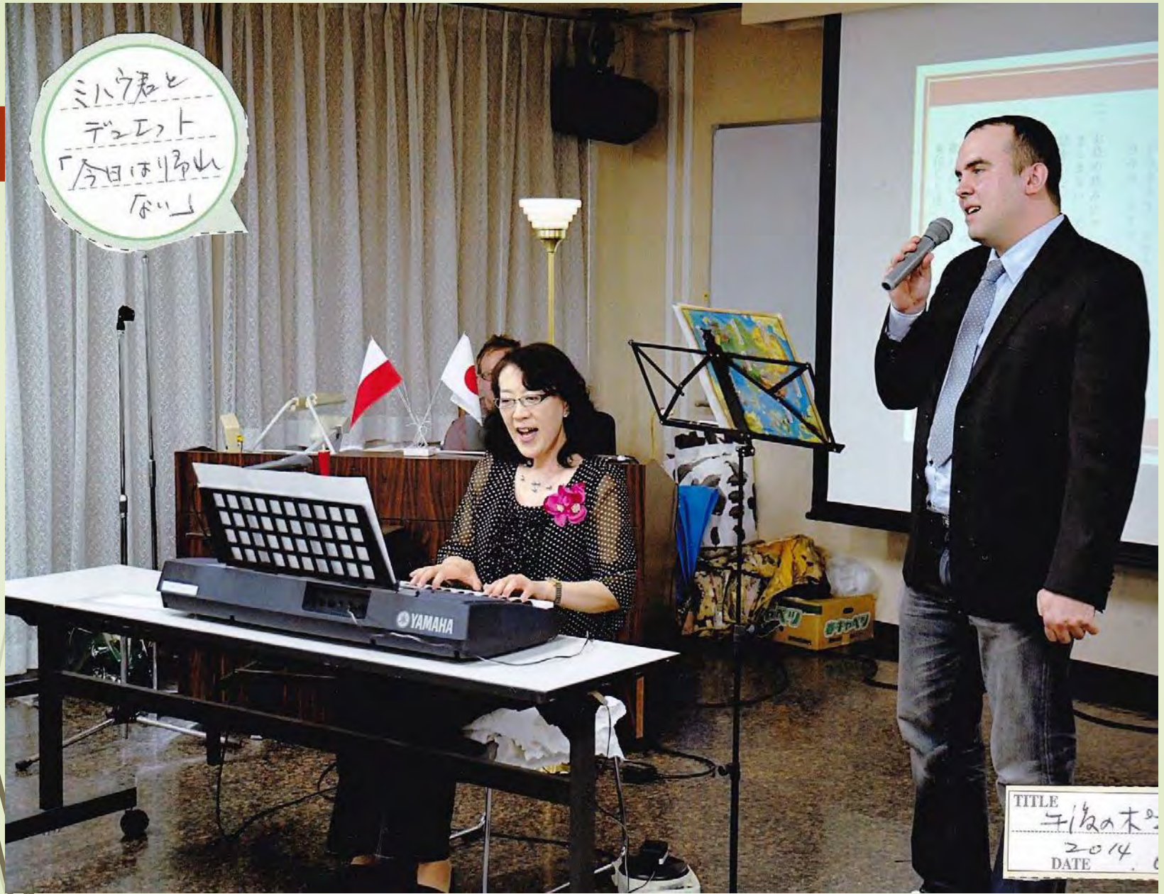
2014年6月「午後のポアジエ」(北大クラーク会館)