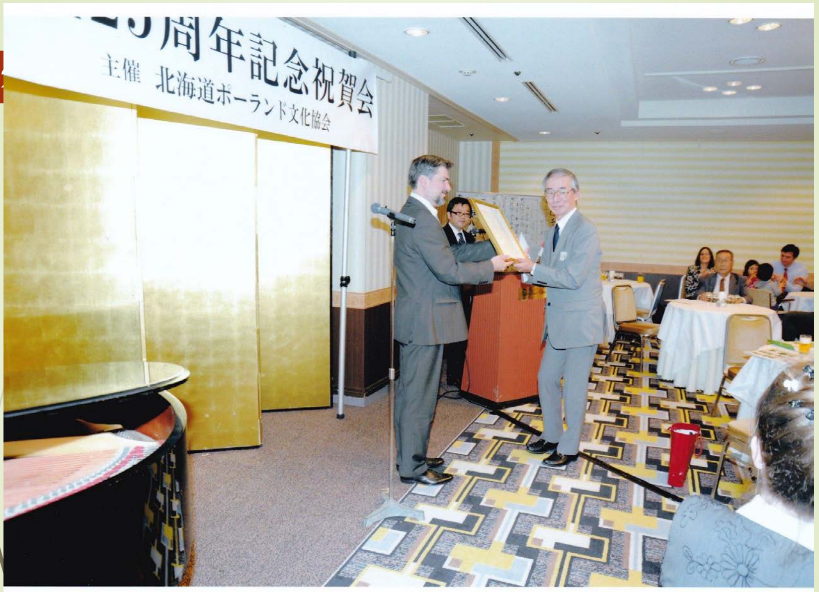
2012年10月 創立25周年記念祝賀会でポーランド大使館から 感謝状をいただく