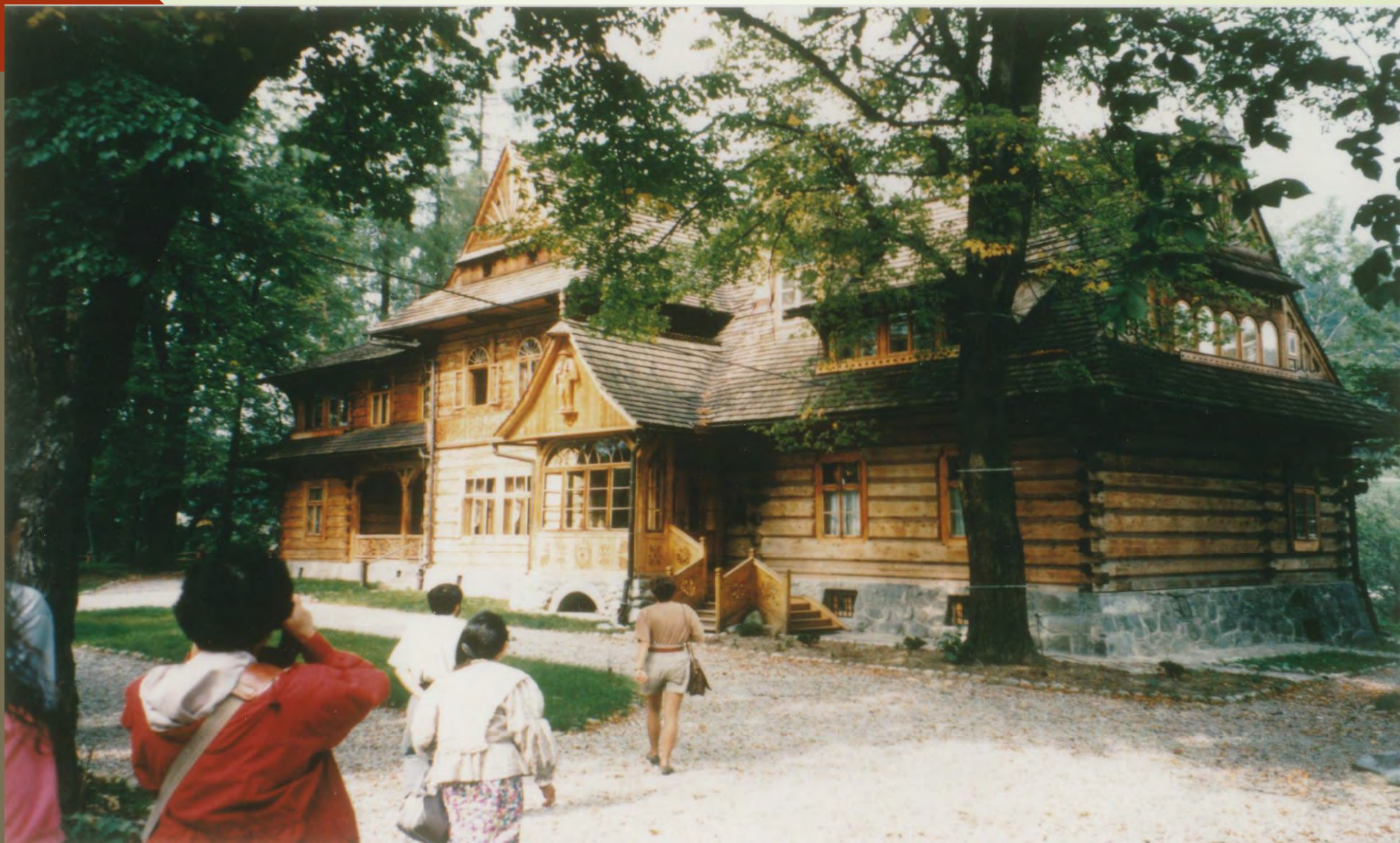
ザコパネの木造建築