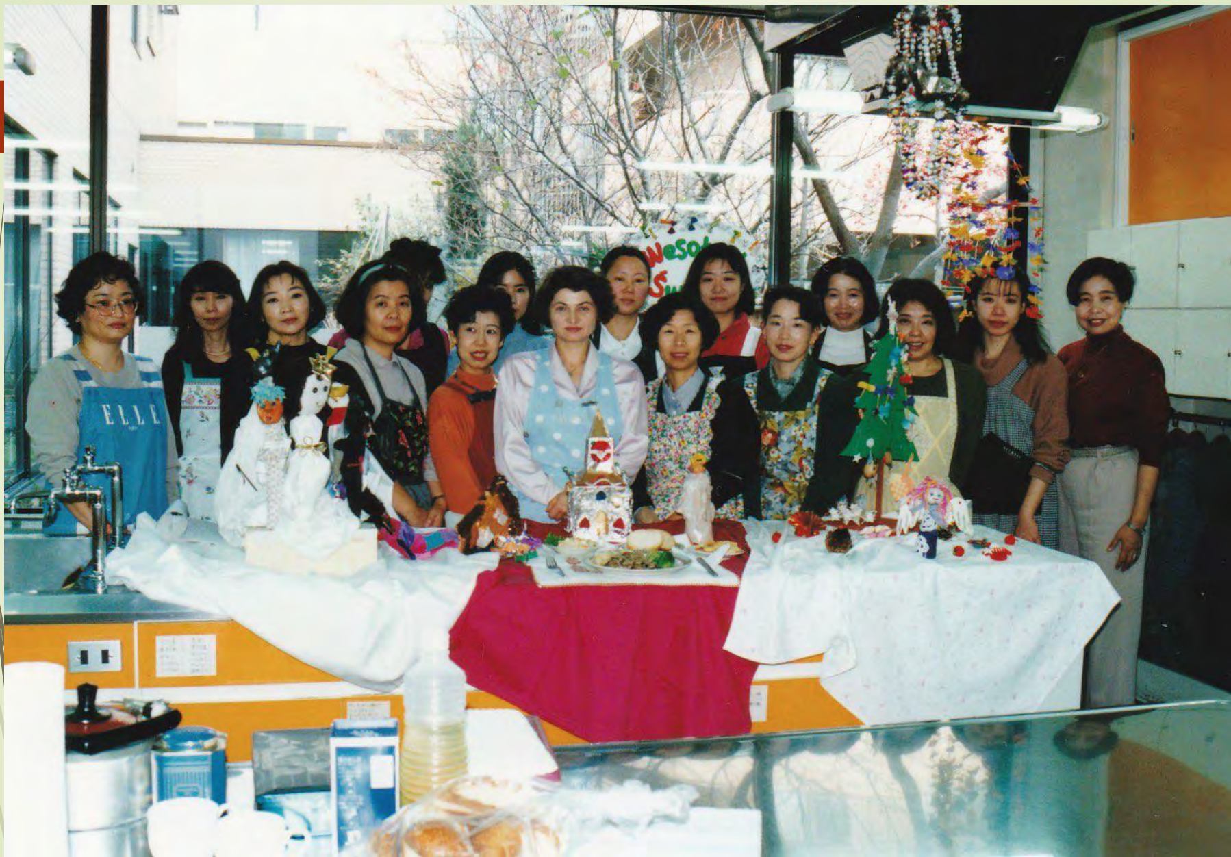
ポーランド料理講習会 1990年ころ