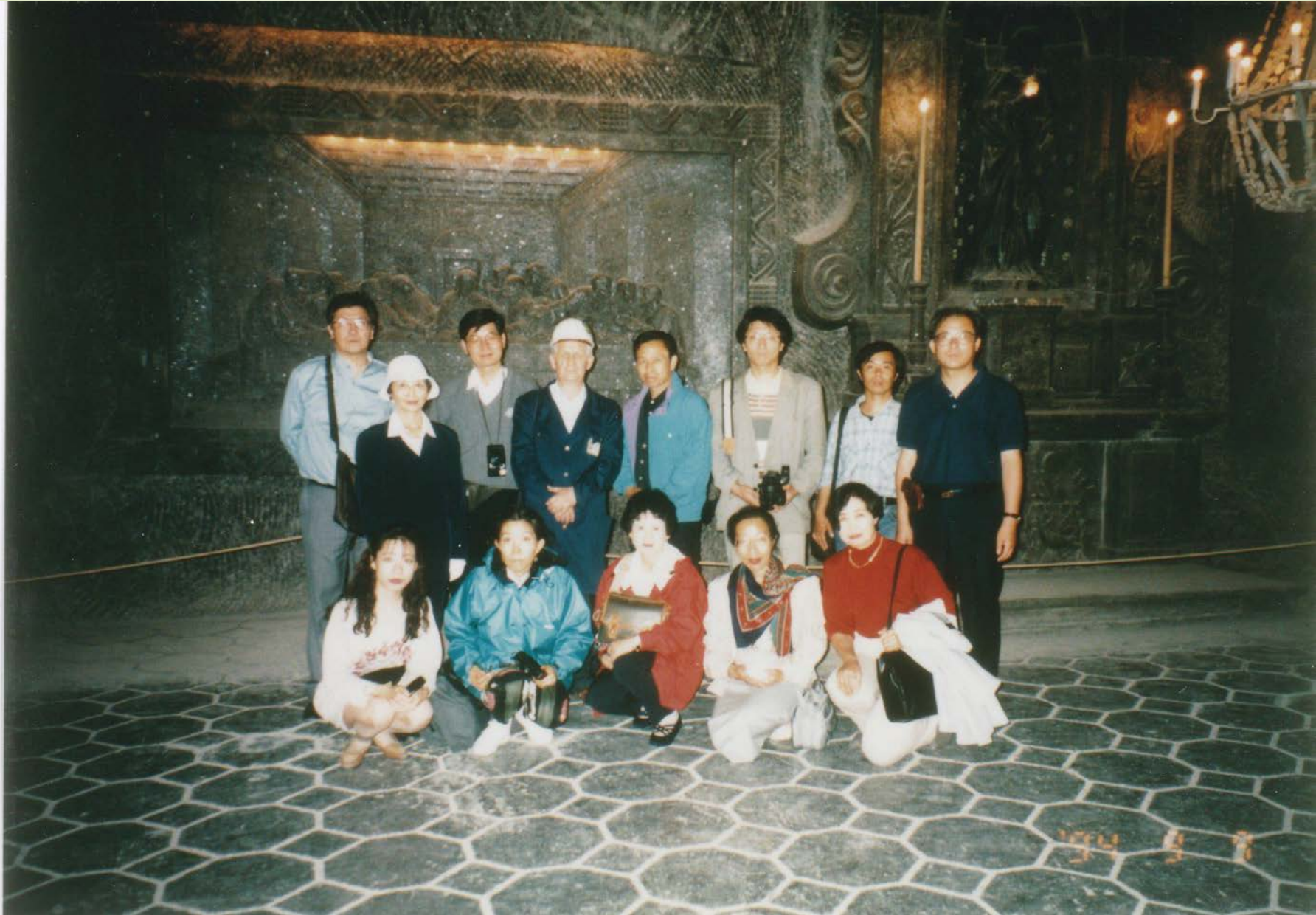
ヴェリチカの岩塩抗の宮殿