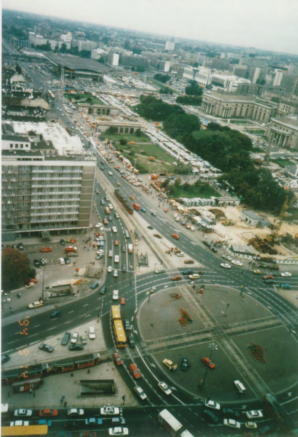
1994年の ワルシャワ中心部