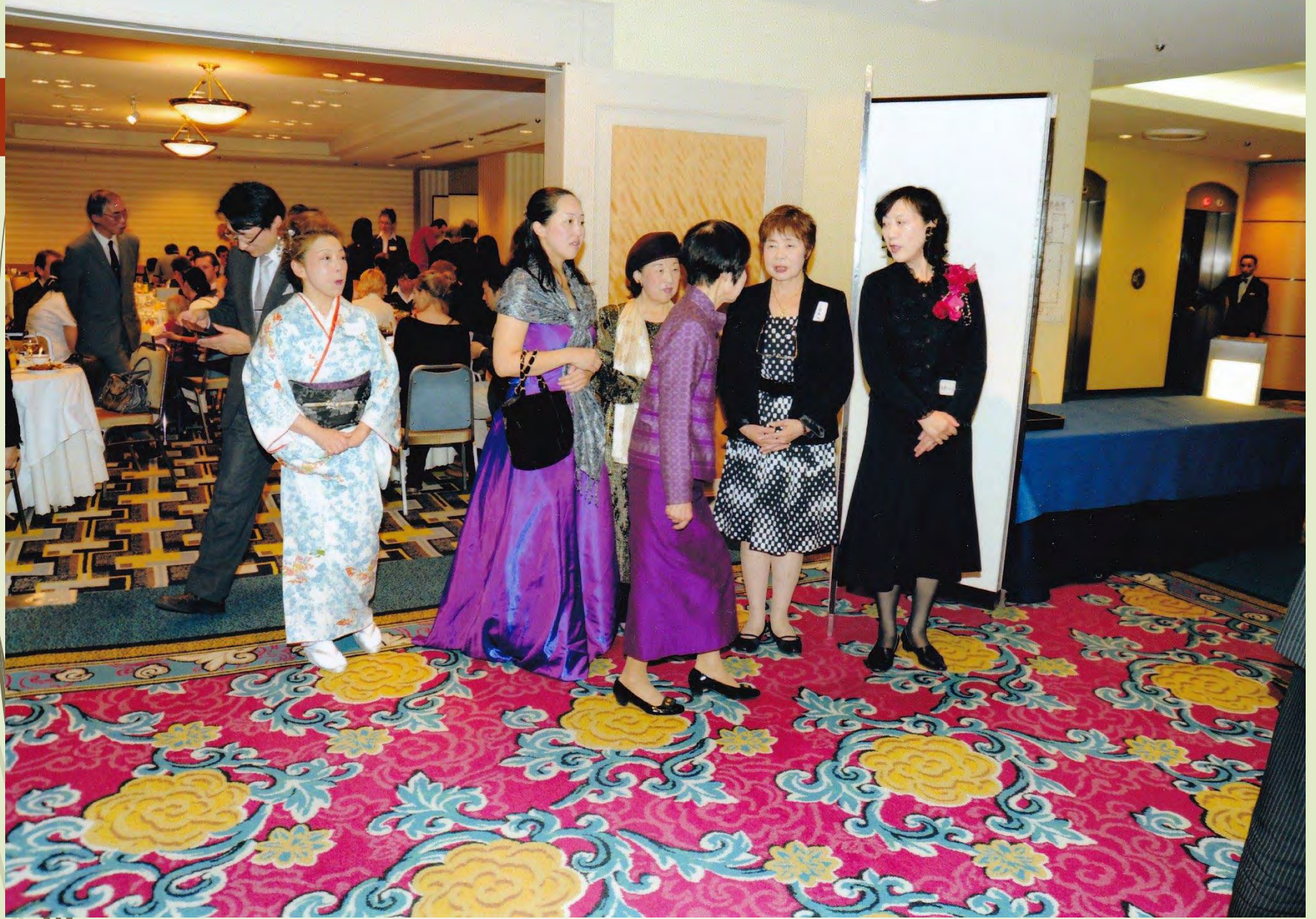
2012年10月 創立25周年記念祝賀会