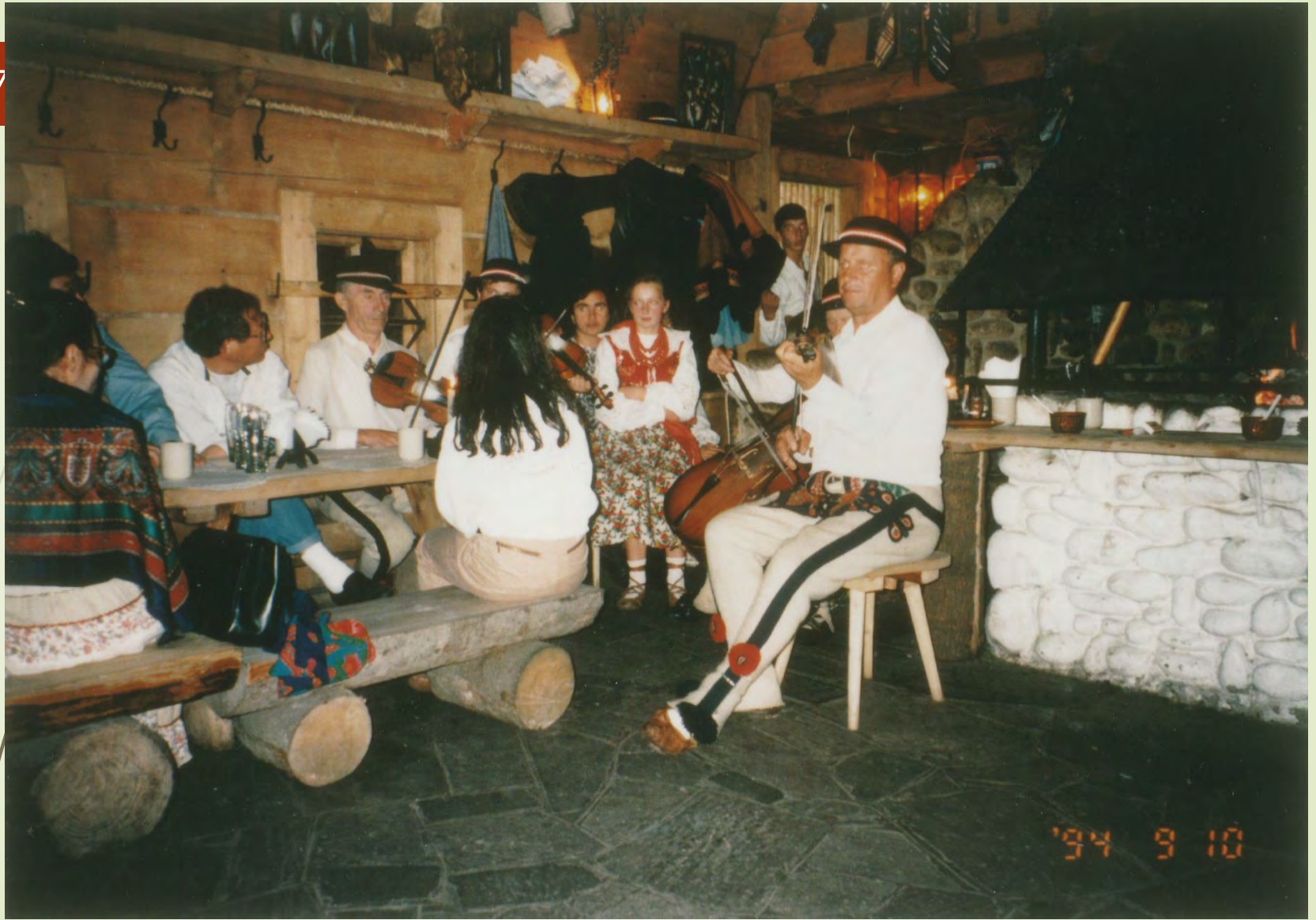
ザコパネの「山賊の家」