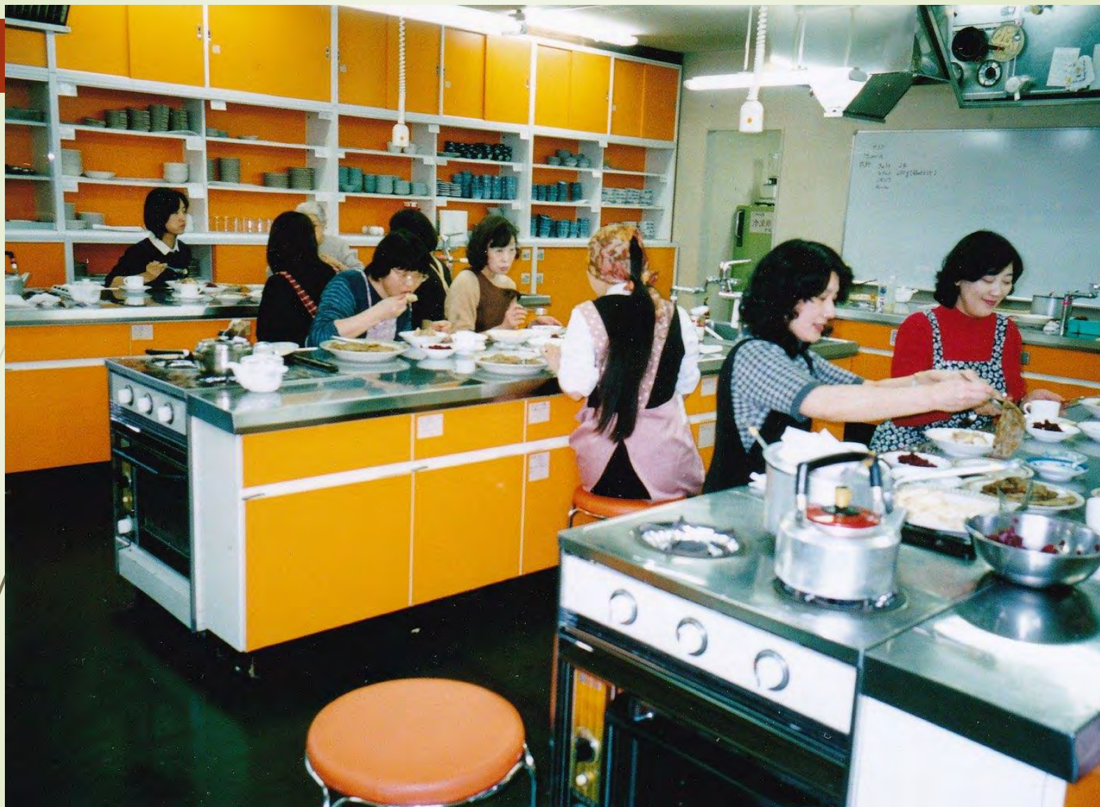
ポーランド料理講習会 2000年代