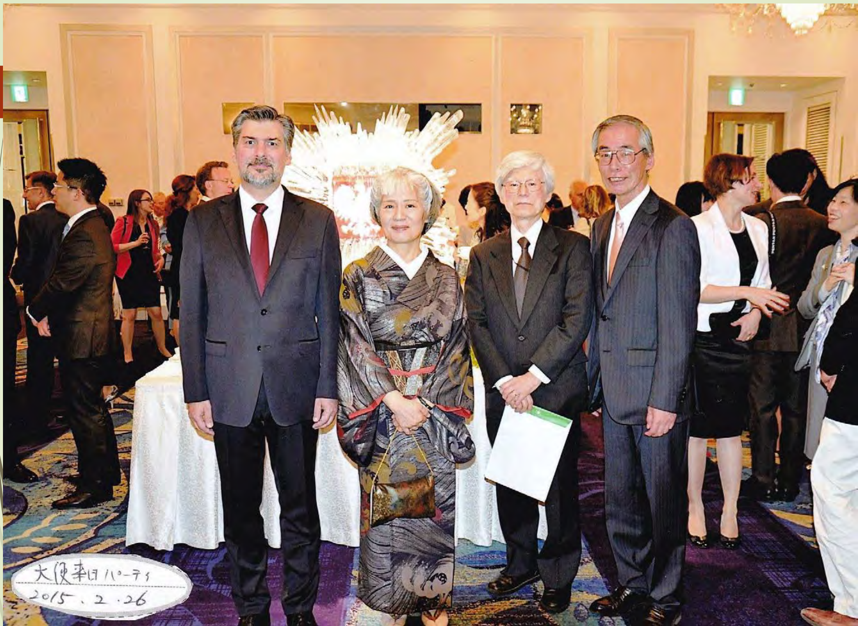
2015年2月 ワルシャワ大使館の大統領歓迎パーティ