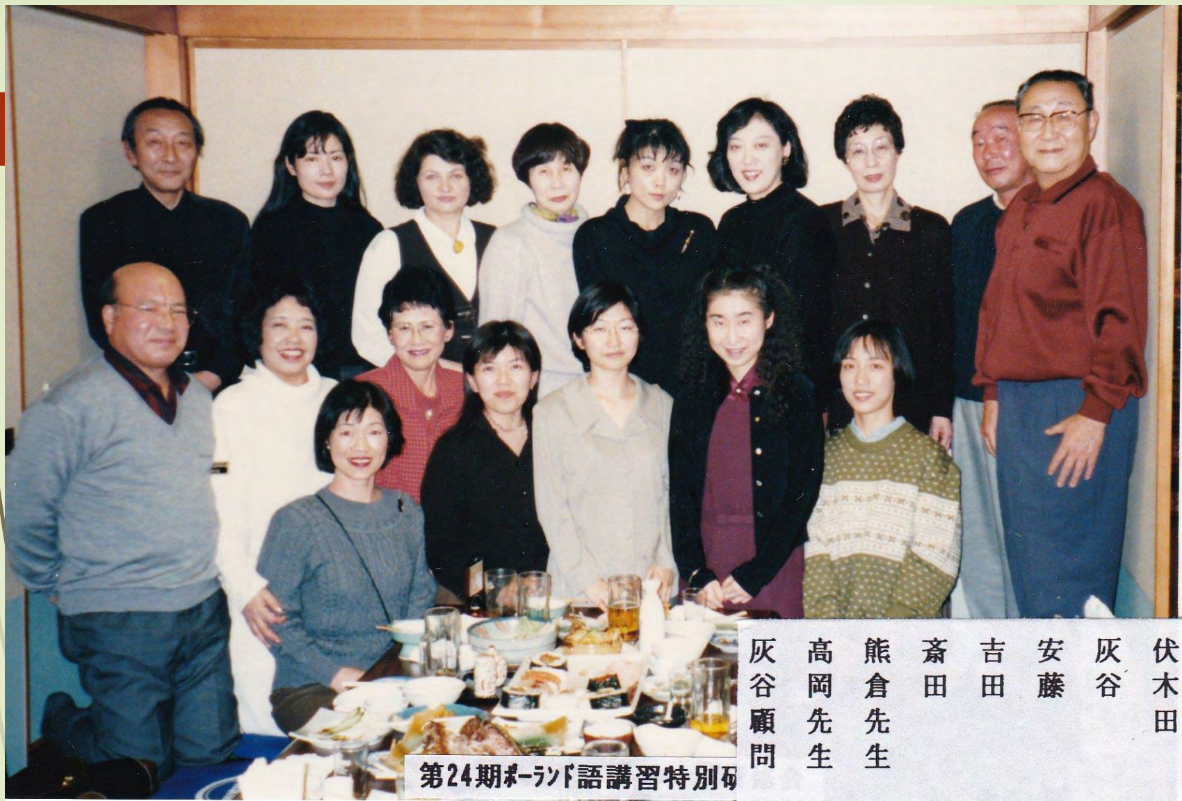
第24期ホーランド語講習特別研