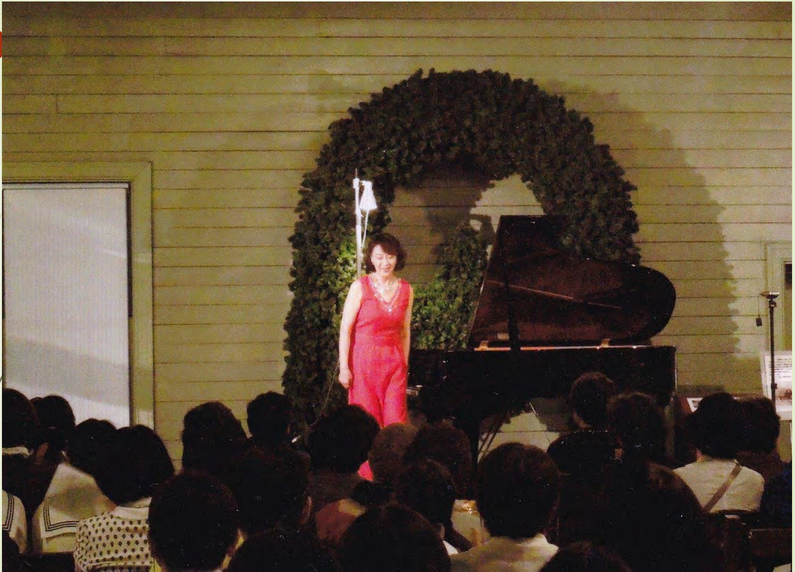
2015年6月 「ピアノで奏でるポーランド」 (時計台ホール)