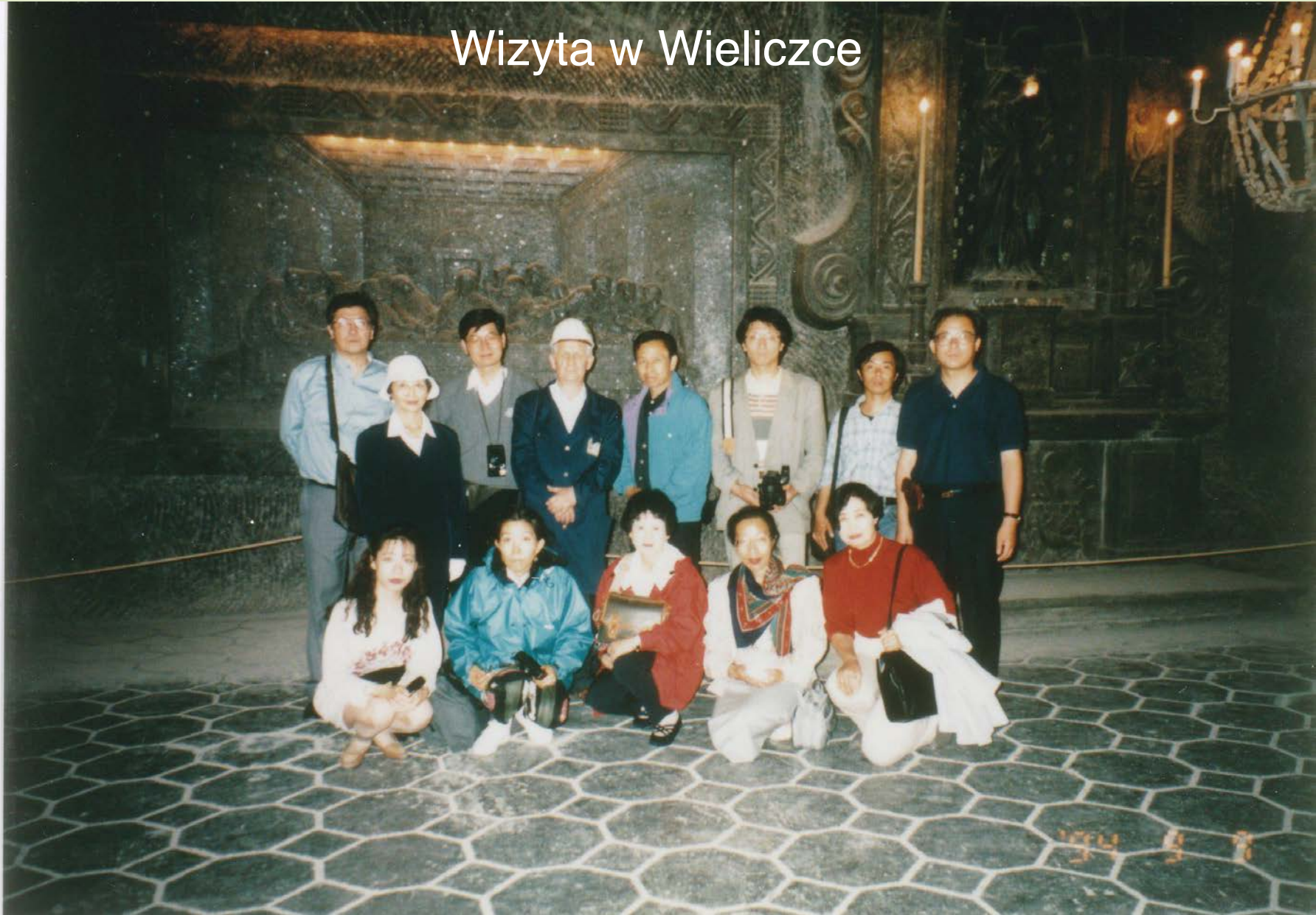
ヴェリチカの岩塩抗の宮殿