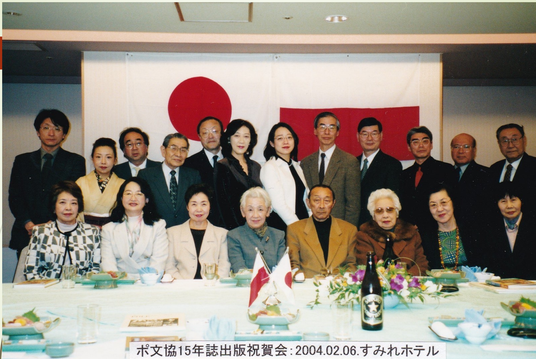
Impreza w hotelu Sumire z okazji 15 lat wydawania czasopisma "Pole"