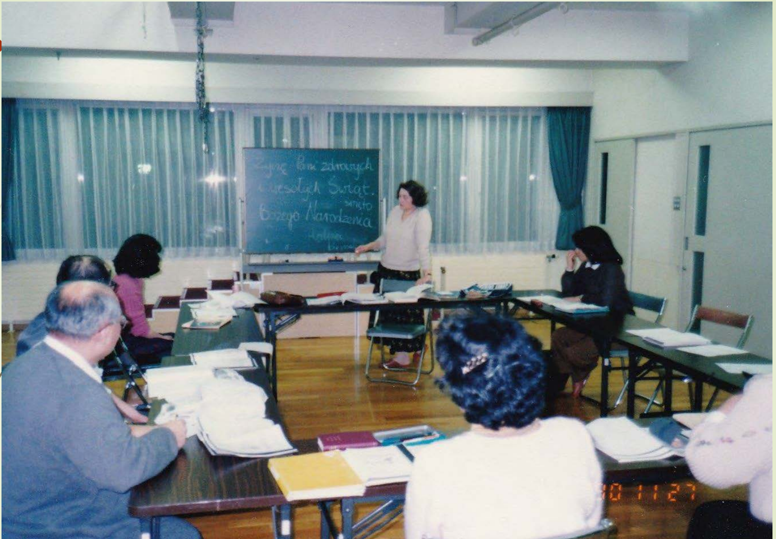
1990年 ポーランド語講習会 1990, lekcja języka polskiego