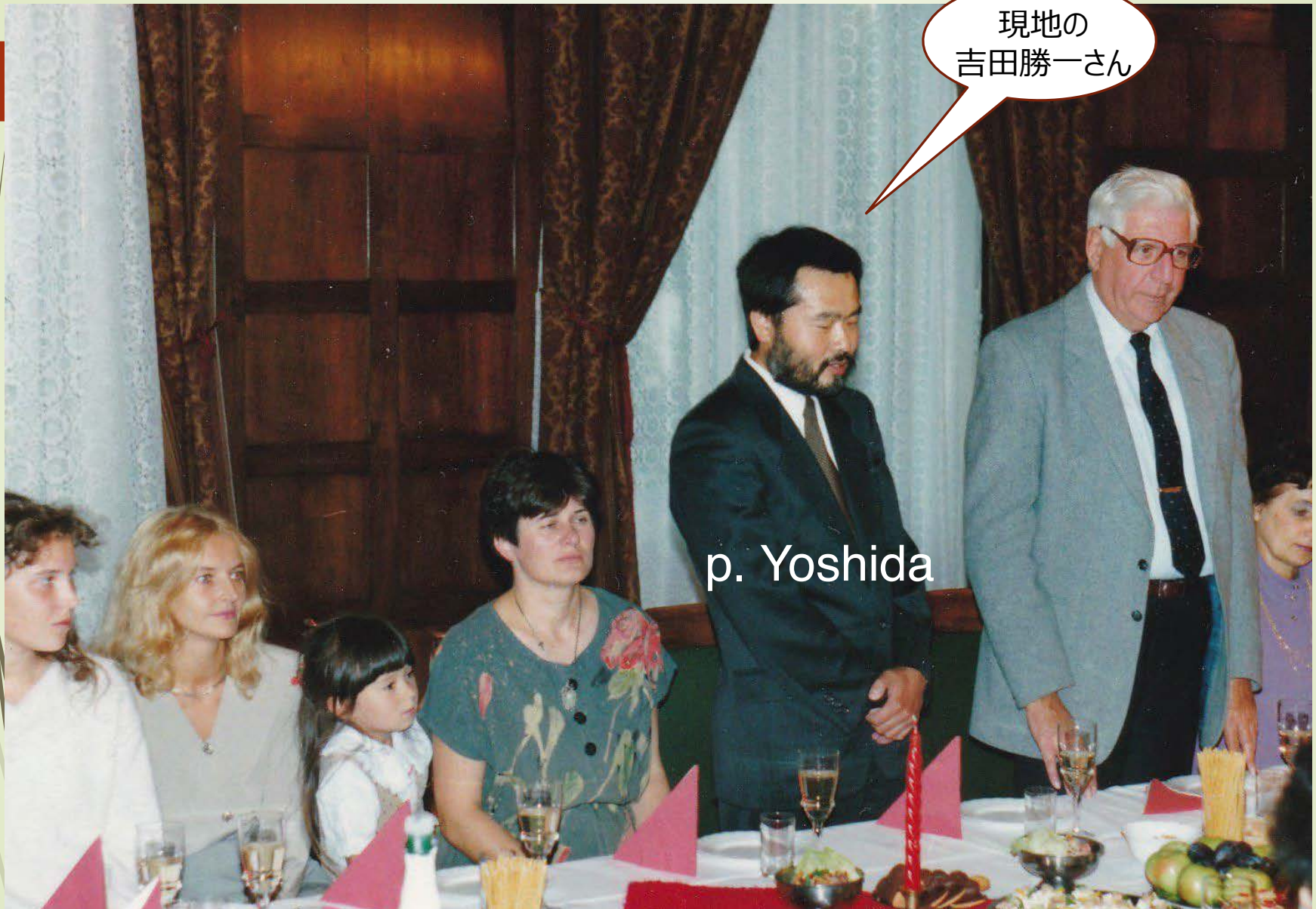
1994年 第1次のポーランド旅行団の歓迎会（ウッチ市）