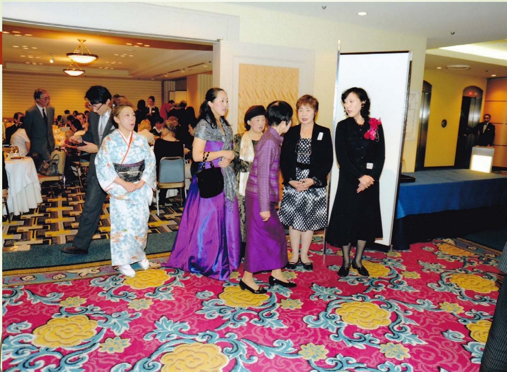
2012.11.03 創立25周年記念祝賀会 Impreza na 25-lecie Towarzystwa