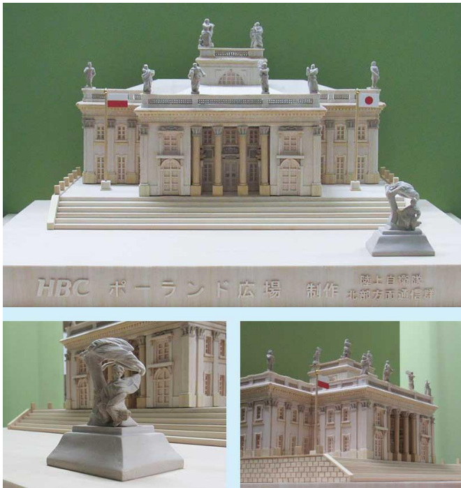
HBC ポーランド広場

「ワジェンキ」とは“浴場”の意味です。国王の夏の離宮で、素晴らしい浴場を備えた宮殿はいつしか「ワジェンキ宮殿」と呼ばれるようになり、そこから公園も「ワジェンキ公園」と呼ばれるようになりました。歴史的な建物が点在する広く美しいこの公園に、1926年に造られたワルシャワ出身の音楽家、フレデリック・ショパンの像は、数ある彼の像の中で最も有名なモニュメントです。強風に煽られた柳の木の下で思いにふける姿のもとで、夏の間は毎週日曜日、「ショパンコンサート」が催され賑わいます。2020年はワルシャワで5年に1度開催される「フレデリック・ショパン国際ピアノ・コンクール」の開催年でもあり、日本人ピアニストの活躍も期待されます。